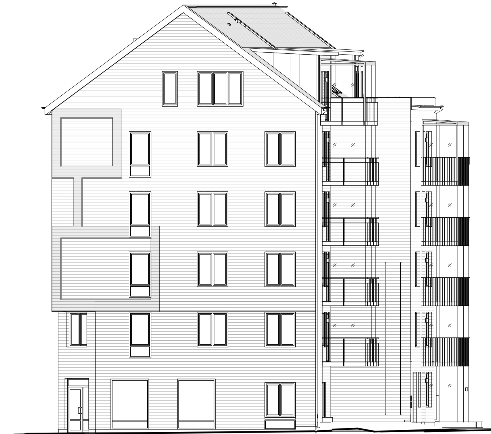
FASAD MOT VÄSTER, GATA