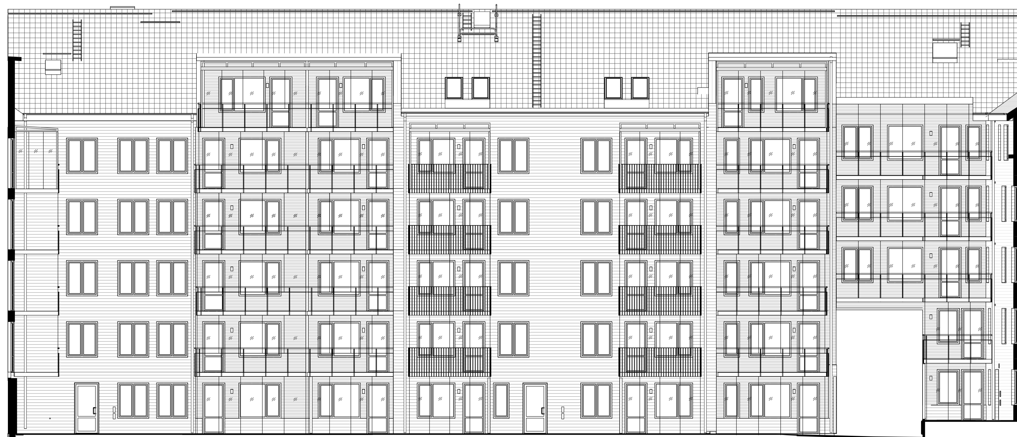
FASAD MOT VÄSTER, GÅRD