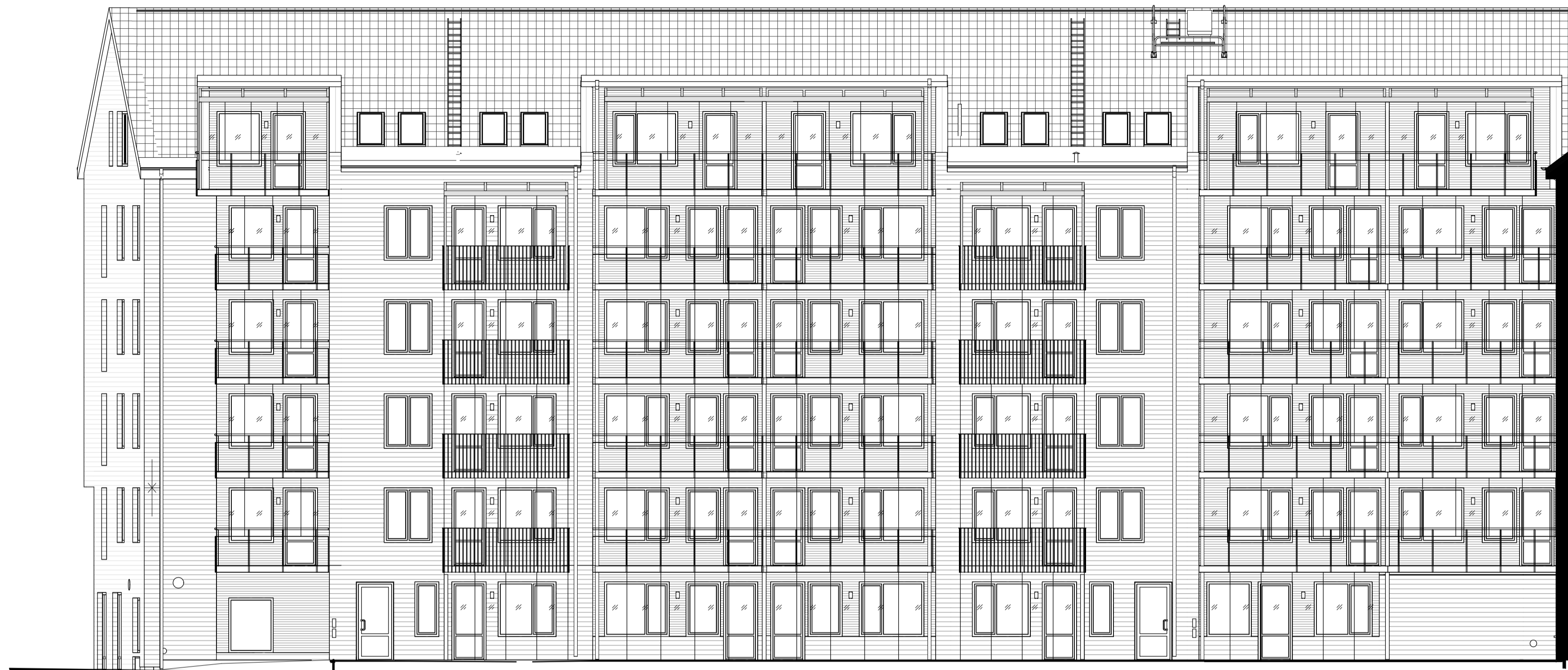
FASAD MOT SÖDER, GÅRD